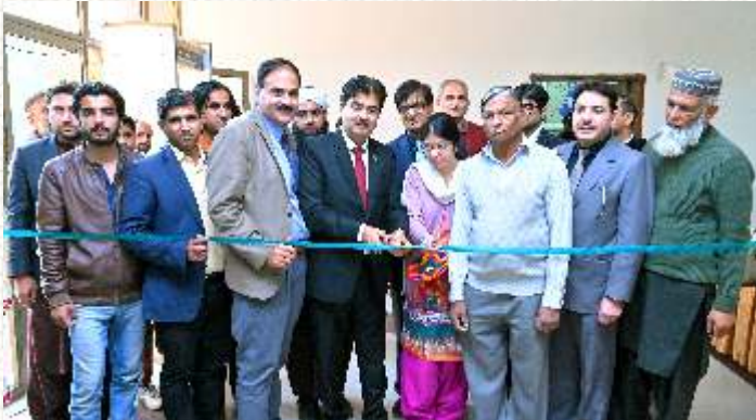
نائب صدر طلعت محمود اعوان آرٹس کونسل میں نمائش کا افتتاح کرتے ہوئے