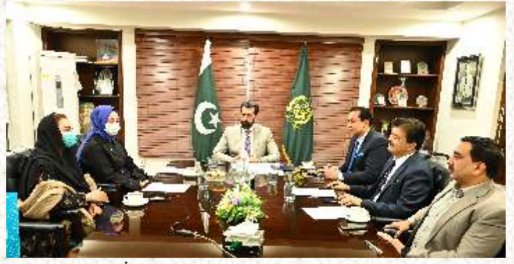
صدر ندیم روف کی پاک ترک سکول ماریف کی پرنسپل اور کیپس ڈائریکٹر کے ساتھ ملاقات و میٹنگ