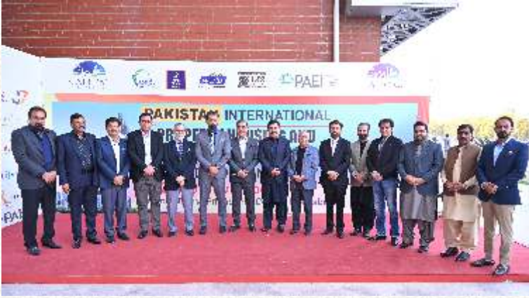
پاک چائنہ سٹراسلام آباد میں پراپرٹی ایکسپو کے موقع پر گروپ فوٹو