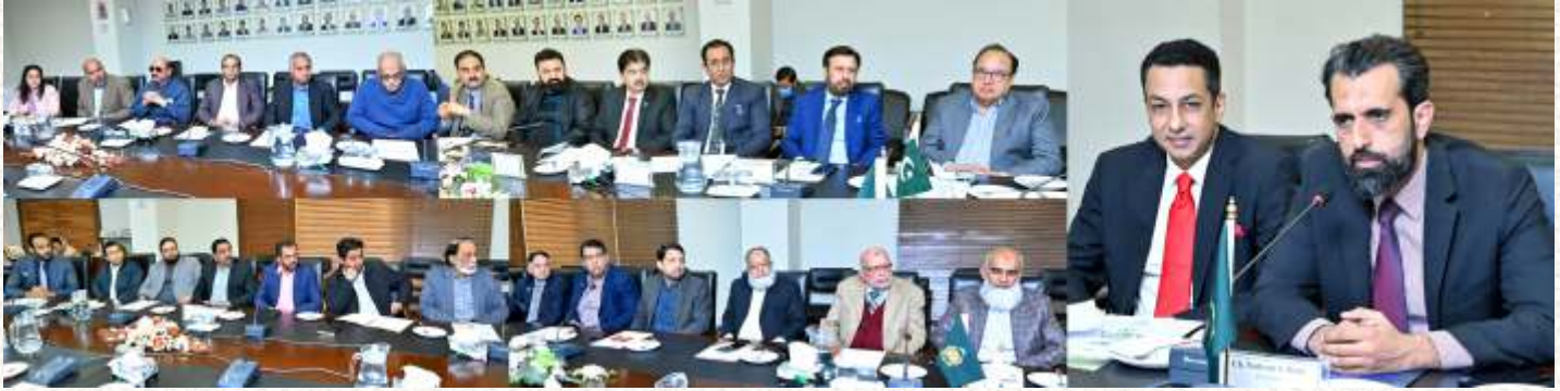
قائمہ کمیٹی برائے دفاعی ساز و سامان کے اجلاس کی صدارت