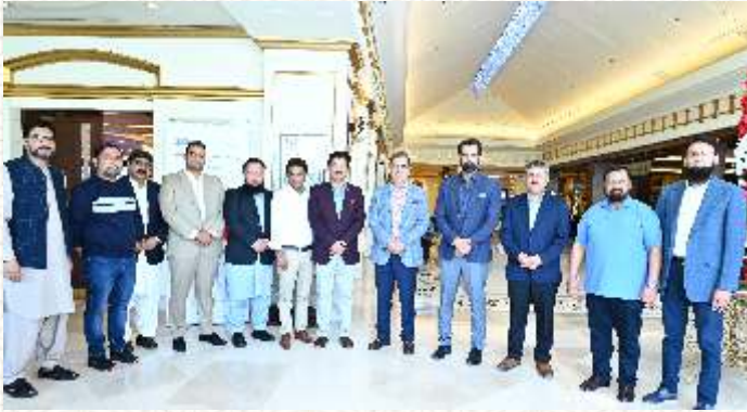
سیڈ کنٹیکٹ لیسز کے افتتاح کے موقع پر چیمبر عہدے داران کا گروپ فوٹو