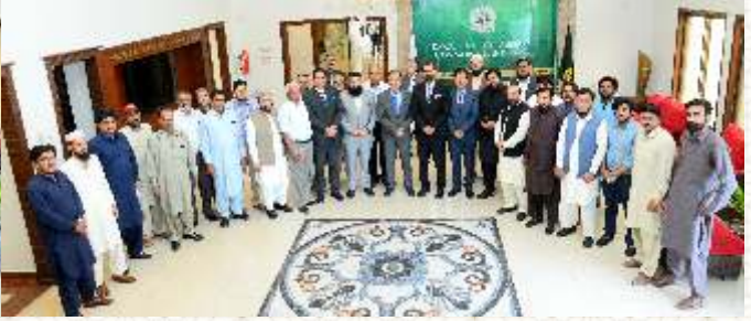
پینٹ ایسوسی ایشن کے وفد کا دورہ