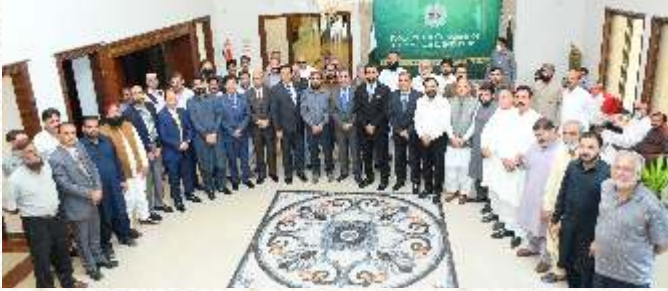
زادہ بختاوری کی قیادت میں وفد کا دورہ چیمبر