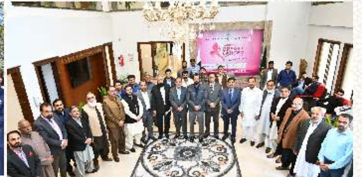
ارشاد اعوان کی قیادت میں وفد کا جیمبر کے دورے کے موقع پر گروپ فوٹو