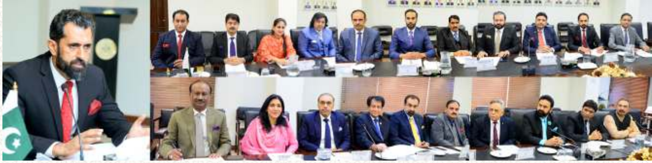
صدر ندیم روف کی زیر صدارت پبلی ایگزیکٹو کمیٹی کا اجلاس