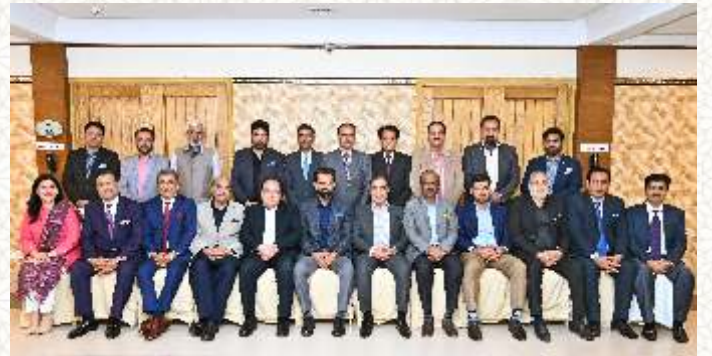
ملک جمشید کی جانب سے دیئے گئے عشیائے کے موقع پر گروپ فوٹو