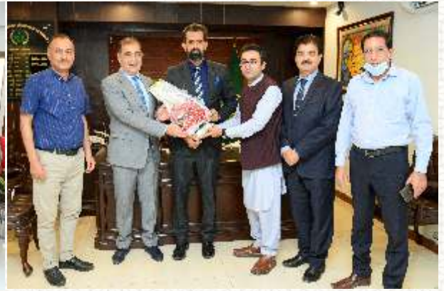
پاکستان پوسٹ کا وفد مبارکباد کا نگلدستہ پیش کرتے ہوئے