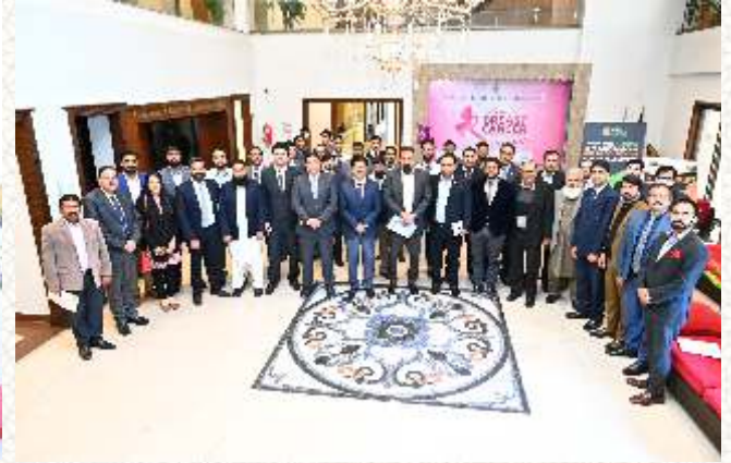
سٹیٹ بینک آف پاکستان کی جانب سے چیمبر میں گرین بینکنگ کے موضوع پر سمینار کے شرکاء کا گروپ فوٹو