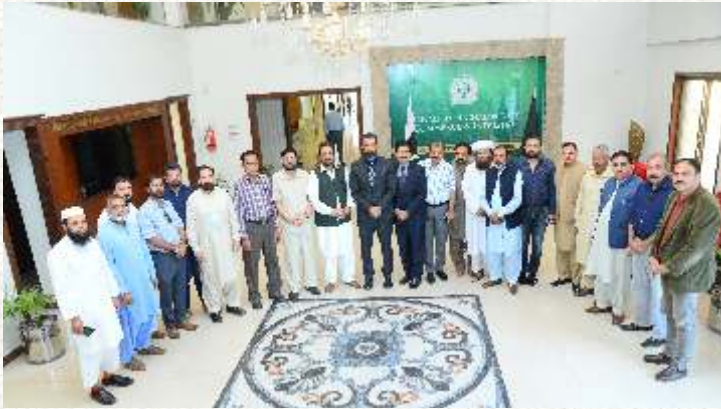
کسٹم کارگو کے وفد کا دورہ چیمبر