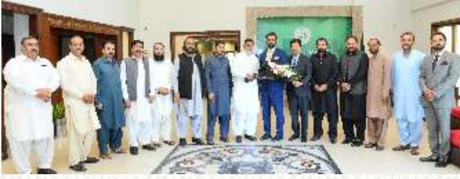
فرنیچر ایسوسی ایشن کے وفد کا دورہ