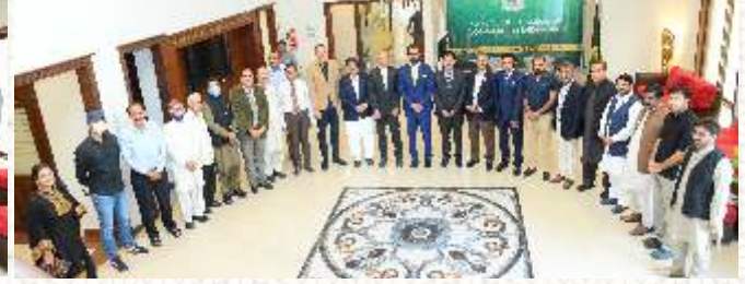
روٹری کلب راولپنڈی کے وفد کا دورہ