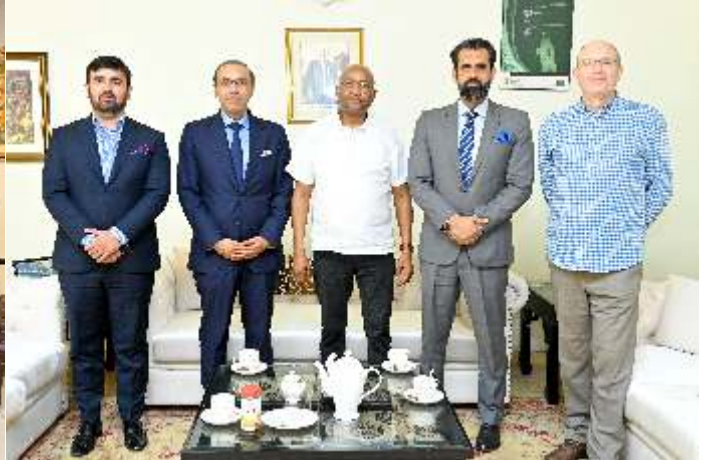
صدر ندیم رؤف کا جنوبی افریقہ کے ہائی کمشنر کے ساتھ ملاقات کے بعد گروپ فوٹو