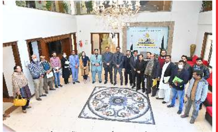
راولپنڈی چیئر میں سمیڈا کے زیر اہتمام تربیتی سیمینار کے شرکاء کا صدر ندیم رؤف کے ہمراہ گروپ فوٹو