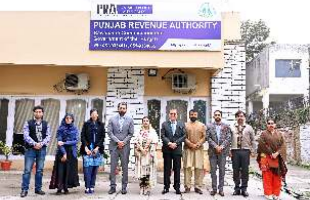
پنجاب ریونیو اتھارٹی میں اجلاس کے بعد گروپ فوٹو