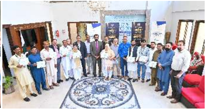
این سی اوی سرٹیفکیٹ دینے کے بعد صدر ندیم رؤف کا شرکاء کے ہمراہ گروپ فوٹو