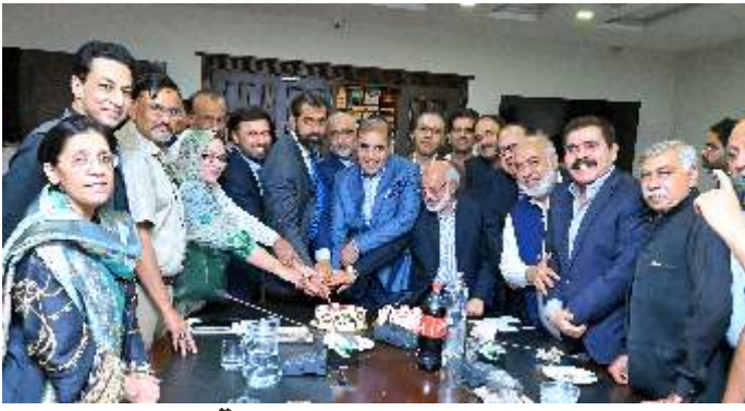
کامیاب ممبر شپ مہم برائے سال 2022-23 کے موقع پر ٹیک کاٹا جا رہا ہے